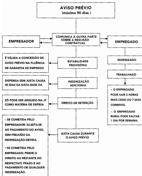
Figura 1: Novo aviso prévio

Logo, a novidade maior é que o novo texto legal assegura o aviso prévio de 30 dias para os empregados com até um ano de serviço, acrescido de três dias para cada ano trabalhado na mesma empresa, limitado a 60 dias (equivalente a 20 anos de trabalho), (Figura 1) de modo que o período máximo de aviso prévio será de 90 dias (PRETTI, 2012).